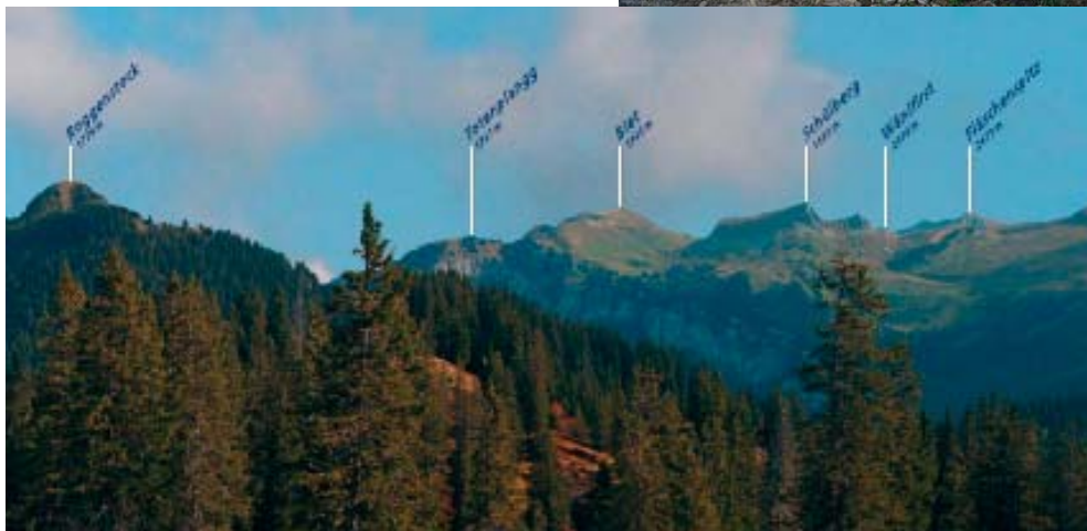
Gruebi Gottertli, Lauerz