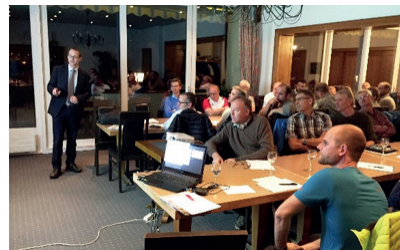
Regierungsrat René Bünter informiert die Behördenvertreter

Beim anschliessenden Apéro erfolgten interessante Diskussionen und reger Erfahrungsaustausch unter den Behördenmitgliedern und den Wanderwegmitarbeitern.